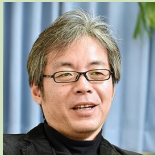
青木 理さん (ジャーナリスト)